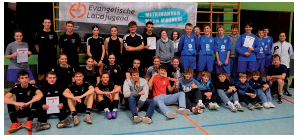
Die teilnehmenden Mannschaften am Turnier - geschafft, aber glücklich