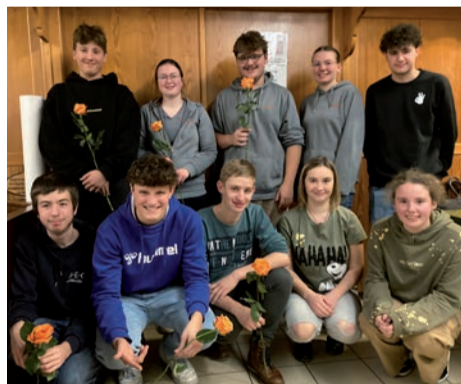
Der neu gewählte Kreisvorstand Nördlingen