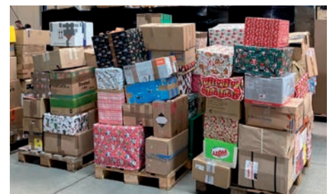
Die Evangelische Landjugend bedankt sich herzlich bei allen, die diese Spendenaktion ermöglicht haben!

nach Albanien, Bosnien, Bulgarien, Ukraine, Rumänien, Republik Moldau und auch Deutschland.