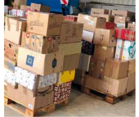
Voll beladen! 587 Hilfspakete für Osteuropa schnürten die ELJ-Kreisverbände Uffenheim und Rothenburg.

Ausdruck von Liebe und Zusammenhalt. Es steht ganz im Sinne der frohen Weihnachtsbotschaft, dass die Menschheit zusammengerückt. Ein herzliches Dankeschön für alle Mithilfe.