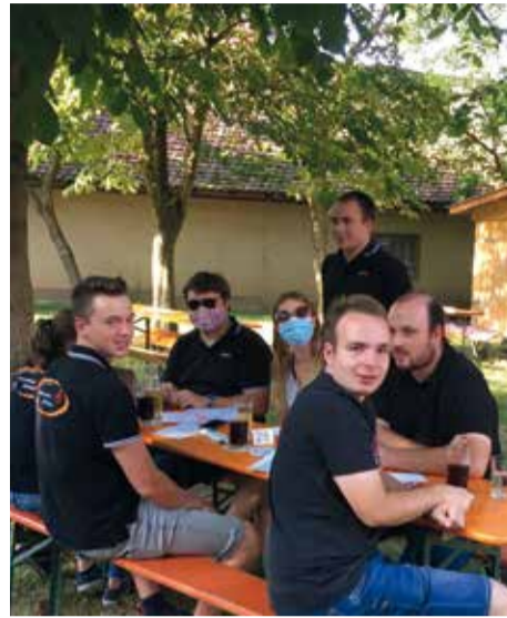
Die Organisatoren, beim Testen der Corona Hygieneregeln.

Ohrenbach - Bei bestem Wetter fand das traditionelle Dankeschön-Essen im Biergarten statt. Mit dabei waren die Gruppen Herrnberechthaus, Gollhofen, Burgbernheim, Unterickelsheim, Oberickelsheim, Gnötzheim, Reusch, Gülchsheim, Gollachostheim, Euquarhofen und Buchheim. Bei leckerem Essen und kühlen Getränken konnten es sich die Vorsitzenden gut gehen lassen! Der KV bedankte sich für all ihre Arbeit - gerade in der jetzigen Zeit! Die Veranstaltung war die erste nach dem Lockdown. Ein besonderes Erlebnis für alle! Dank dem ELJ-Hygiene-Konzept können viele weitere folgen.