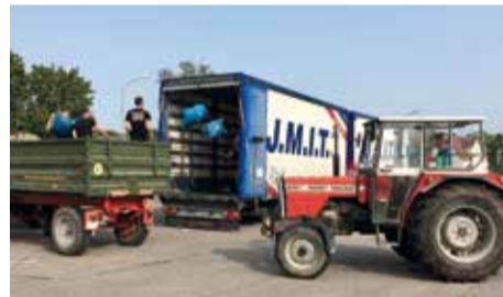
Die Uffenheimer Altkleidersammlung war ein Erfolg! ELJ ist eben wenn´s trotzdem klappt!

hausen, Rudolzhausen, Uffenheim, Wallmersbach, Ergersheim, Euquarhofen, Simmershofen, Uttenhofen, Ippesheim, Ehenheim, Gollhofen, Gnötzheim, Unterickelsheim, Oberickelsheim und Gülchsheim!