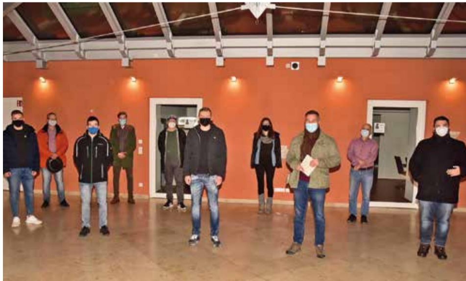
Die ELJ Gruppen Osterdorf und Bieswang bewiesen während der Pandemie ihre hohe Engagementbereitschaft und erhielten dafür eine außerordentliche Anerkennung.

Die ELJ Osterdorf und die ELJ Bieswang hatten sich auch bereiterklärt bei der Initiative „Pappenheim hilft“ mitzumachen. Die Stadt Pappenheim übernahm dafür die Organisation und die Koordination. Bedürftige Bürger_innen konnten sich melden. Die Gruppen haben dann verschiedene Einkäufe und Besorgungen übernommen.