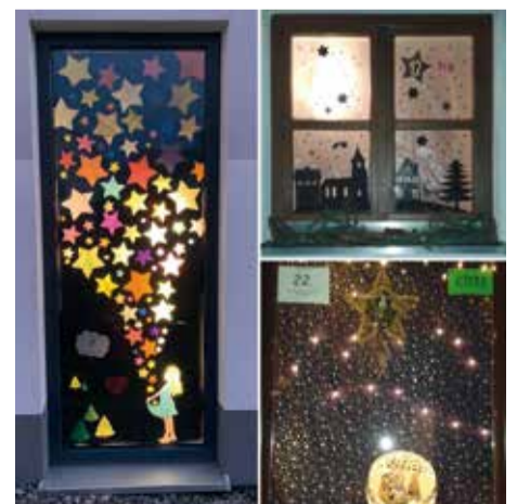
Bunte Adventsfenster schmückten Ehringen in der Vorweihnachtszeit.

packen und überbringen: Für die Aktion hat die ELJ Ehringen viel Zeit und Energie investiert. Die einhellig positive Resonanz im Dorf war der verdiente Lohn.