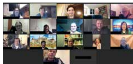
Heiteres Onlinezusammenkommen des ELANs zur Mitgliederversammlung. Durch die gesparte Anreise, war es vielen Mitgliedern möglich, ganz unkompliziert an der Veranstaltung teilzunehmen.