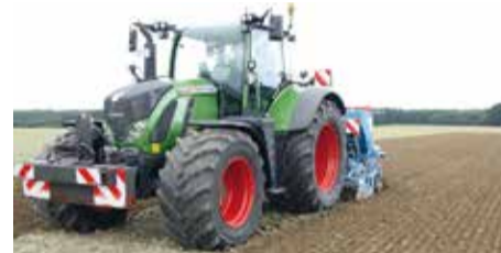
Auch schon vor der Corona-Pandemie erlebte die Landwirtschaft erhebliche digitale Fortschritte.

Es klingt wie Zukunftsmusik und kann bald Realität auf deutschen Äckern werden. Um