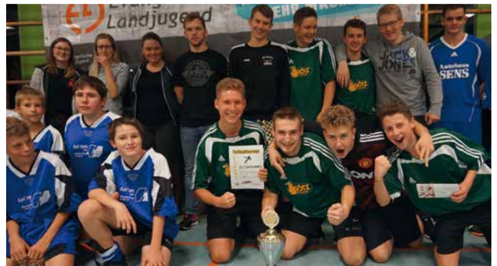
Im Bild das Sieger-Team der ELJ Dürrenzimmern.