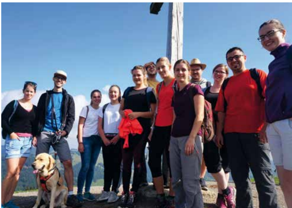
Die Teilnehmer-Gruppe auf dem Hündle-Kopf.

Spektakulärer Höhepunkt war der Abstieg zu den Buchenegger Wasserfällen, die so manchen zu einem eiskalten Fußbad verleiteten. Ein gemütlicher Grillabend am Lagerfeuer bildete den Ausklang des erlebnisreichen Tages. Nach einem leckeren Brunch war das Wochenende für die meisten auch schon vorüber. Nur ein kleiner Trupp Unentwegter ließ es sich nicht nehmen, im Vorbeifahren noch schnell den Gipfel des Grünten „zu machen“.