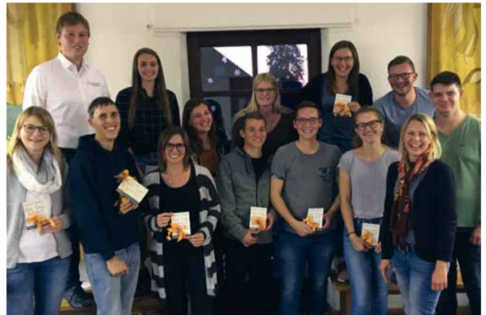
Das Suchspiel: Wer gehört zur neuen ELJ Kreisvorstandschaft Neustadt?