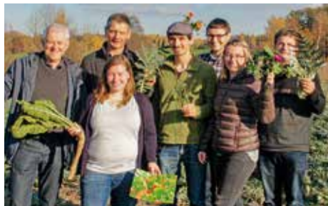
Eine Vielfalt an Kräutern und Heilmitteln gibt es auf dem Betrieb Funke!

die Erzeugung rasch umzustellen. Das bedeutet auch, oft neue Wege im Anbau und der Ernte zu gehen. Für die rund 40 Teilnehmenden von ASA und ELJ sowie den Gästen des Bauernverbandes war es ein informativer Tag, der durch die Gastfreundschaft der Familie Funke zu einem besonderen Highlight wurde.