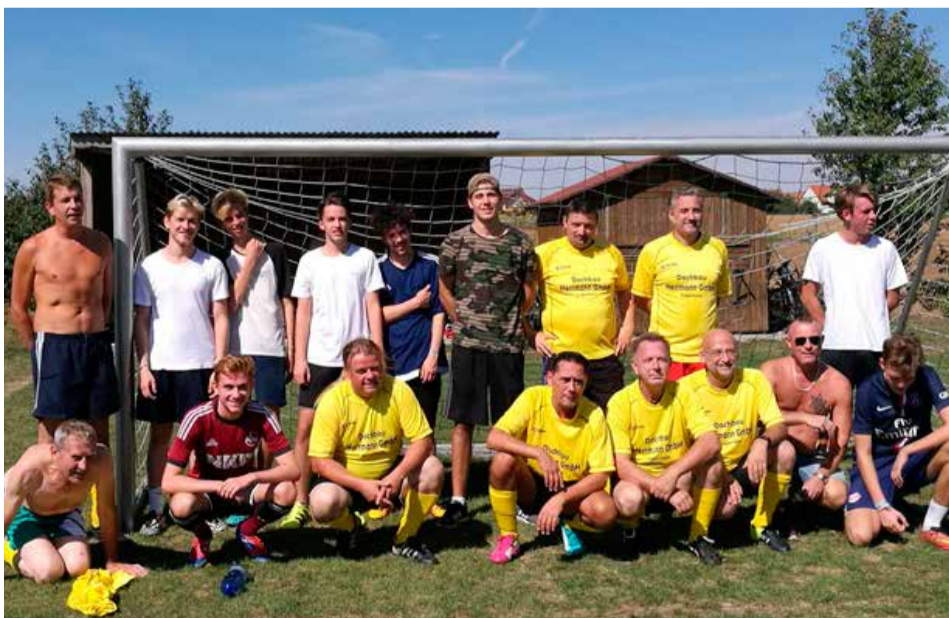
Die ELJ Uffenheim gewann mit 7:1 haushoch gegen die „alten Herren“, doch eine Revanche lässt nicht lange auf sich warten!

Die „alten Herren“ erwiesen sich jedoch als faire Verlierer und halfen anschließend den Jungen beim Verzehr der Siegesprämie. Dabei wurden das Spiel und die vermeintlichen Fehler nochmal genau analysiert. Das Ergebnis: Es soll eine Revanche geben - aber nicht im Fußball, sondern vielleicht im Paintball, damit beide Mannschaften eine gleiche Siegeschance haben.