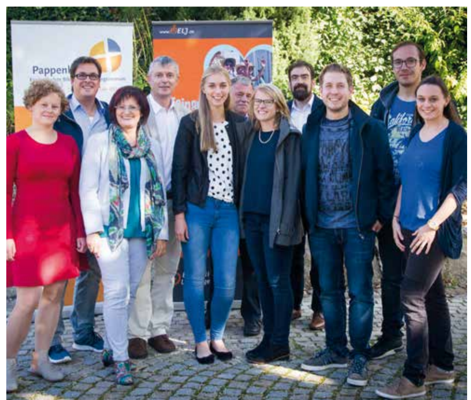
In Pappenheim trafen sich ELJ und SPD-Vertreter zum Fachgespräch darüber, wie junge Menschen an der Entwicklung ihrer Heimat beteiligt werden können.