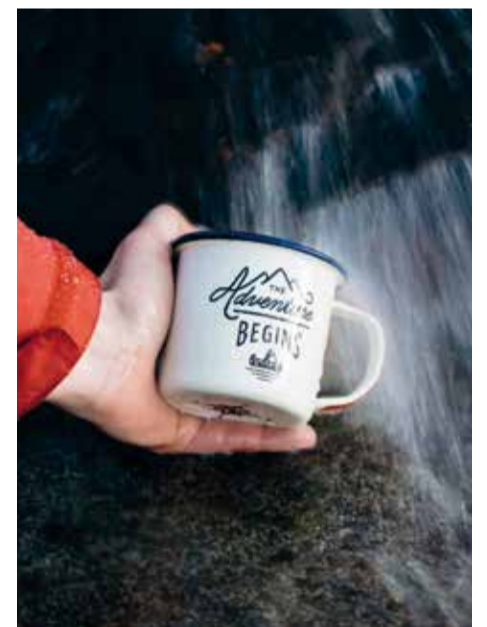
Wie ein Coffee-to-go oder ein fließender Bach, sind auch wir ständig in Bewegung!

Für unsere Zukunft in der Landjugend kommt Veränderung - ganz sicher! Lass sie uns in die Hand nehmen und gestalten, dass wir mehr miteinander machen: mehr lachen, mehr weinen, mehr singen, mehr spielen, mehr lieben. Zukunft beginnt schon jetzt - mit deiner Entscheidung!