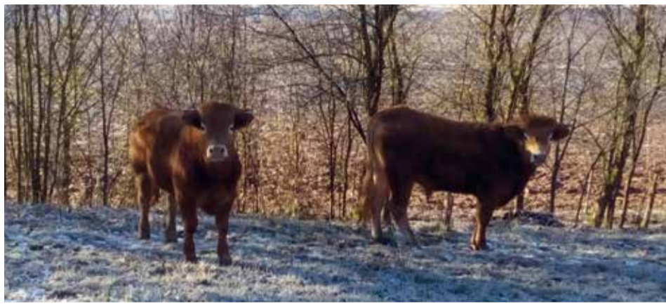
Dick und Doof genießen den großen Freilauf.