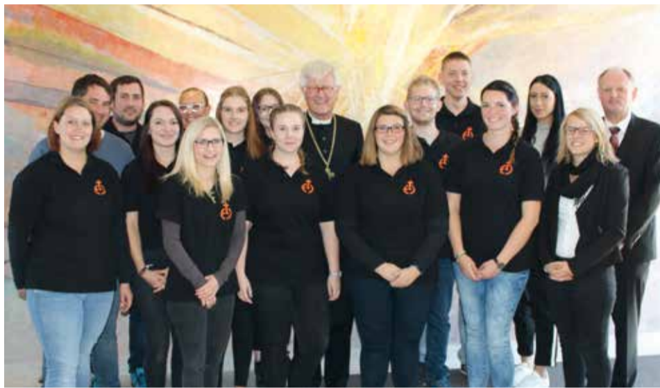
Nächstenliebe und Gemeinschaft wird in der ELJ gelebt, dafür bekam sie bei der 350-Jahr-Feier der Dreifaltigkeitskapelle in Hain Lob und Anerkennung.

Später, in der alten Schule in Hain, würdigt er auch das Engagement der ELJ Hain, die sich nicht nur an diesem Fest für ein gemeinschaftliches Miteinander einsetzen und eine Bereicherung für den Ort und für die Gemeinschaft sind.