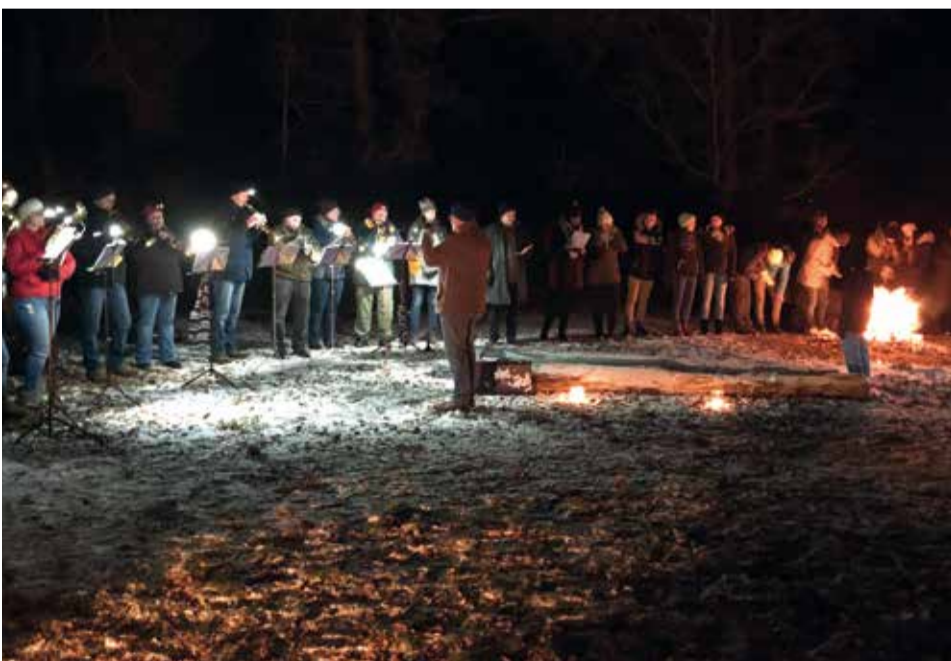
Stimmungsvolle Waldweihnacht in Landersdorf.

(rz) - Stimmungsvoll war's wieder. Bei der Waldweihnacht des KV Roth-Hilpoltstein am Keltenhaus in Landersdorf.