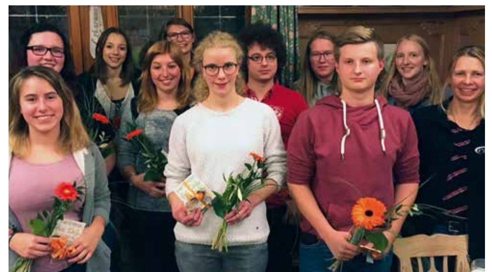
Der neuen Vorstandschaft viel Freude und Erfolg für die gemeinsame Zeit!

(bb) - Die ELJ-Mitglieder im Raum Rothenburg haben ihre neuen Vertreter gewählt. Ein starkes Team, bei dem mit großartigen Veranstaltungen zu rechnen ist!