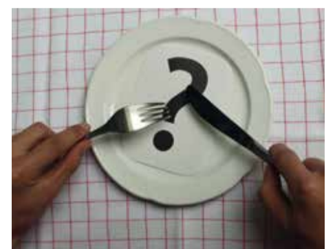
Was wird in Zukunft auf unseren Teller kommen?

Alles nur Gedöns? Leider ja, für all diejenigen, die auch in Zukunft abgehängt sind vom Wohlstand und ihr Dasein in Hungergebieten fristen. Oft sind es Kleinbauern auf dem Land, denen es am Nötigsten fehlt. Dieses Elend zu bekämpfen wird wohl die größte Herausforderung bleiben.