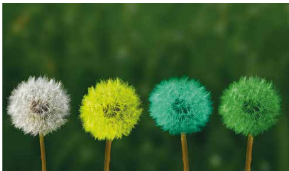
Keiner weiß, was die Zukunft bringt, denn Zukunft heißt Veränderung!

(gs/mw) - Was ist ein strukturelles Defizit? Für die ELJ ist es ein Problem. Das Problem besteht darin, dass Jahr für Jahr die Kosten des Verbands steigen, die Einnahmen aber nicht. Manche Einnahmen sinken sogar.