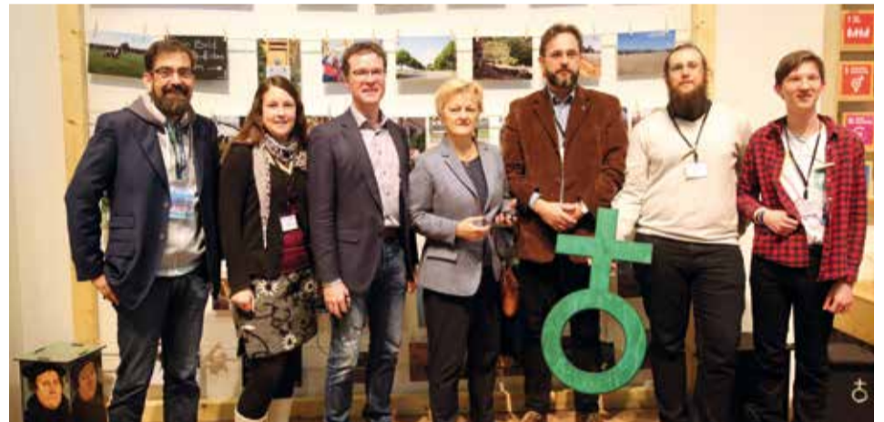
Die Internationale Grüne Woche in Berlin gibt Möglichkeiten mit Politiker_innen ins Gespräch über den ländlichen Raum zu kommen.