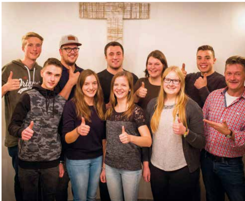
Mit Daumen hoch geht es für die ELJ Roth-Hilpoltstein in ein neues Vorstandsjahr.