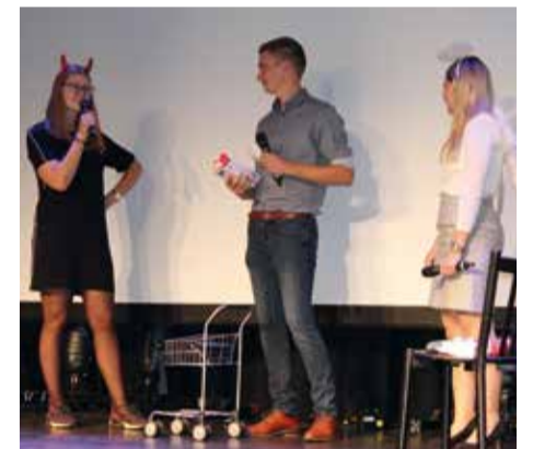
Im Supermarkt und anderswo hast du durch deine (Kauf-)entscheidungen die Wahl. Was ist dir wichtig?

Abgeschlossen wurde der Abend durch eine Andacht von Pfarrer Hadem aus Roth. Er erzählte davon, dass Gott immer wieder Menschen auswählt. Nicht immer nur die vorbildlichsten Zeitgenossen. Also Menschen wie DU und ICH. „Wir haben die Wahl, ob wir Gott vertrauen, die Wahl annehmen und damit beitragen, das Gute in die Welt zu tragen“. Das Gute muss wachsen und braucht Hilfe. Es geht dabei um Treue, Mithilfe und Solidarität.