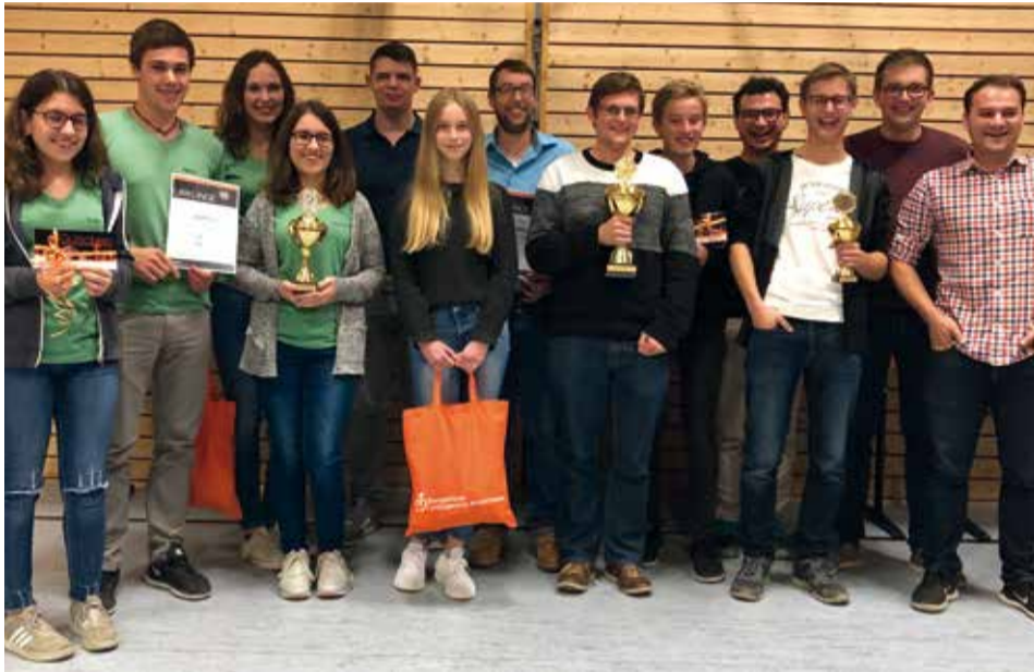
Die Siegerteams beim Bezirksquiz 2018 in Geslau.

Am Ende gewann die ELJ Gollhofen (KV Uffenheim), vor der ELJ Stetten (KV Gunzenhausen) und der ELJ Schwabach (KV Roth-Schwabach)