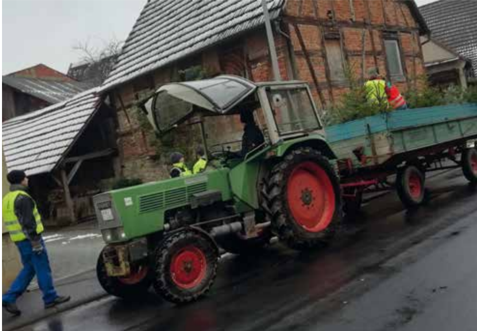
Wie wir nicht nur aus der IKEA-Werbung wissen, müssen Tannenbäume auch wieder entsorgt werden. Die EL Oberaltertheim kümmert sich drum!

Christbaumaktion der Oberaltertheimer Länd