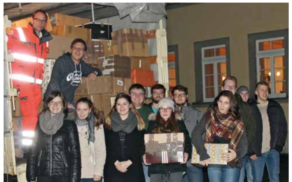
Einige der „Paketengel“ vor dem vollgeladenen LKW.

und Punsch auch selber wieder aufwärmen konnten. In den Hilfspaketen sind dringend benötigte Grundnahrungsmittel, Hygieneartikel und auch ein kleines Kinderspielzeug für notleidende und bedürftige Kinder, Familien, alte Menschen und Menschen mit Behinderung. Mit den Paketen kann vielen Familien, die es bitter notwendig haben, eine Freude bereitet werden. Nach den Feiertagen machen sich die Johanniter mit über 40 LKW auf den Weg nach Südosteuropa, um die Pakete direkt an die Bedürftigen zu geben.