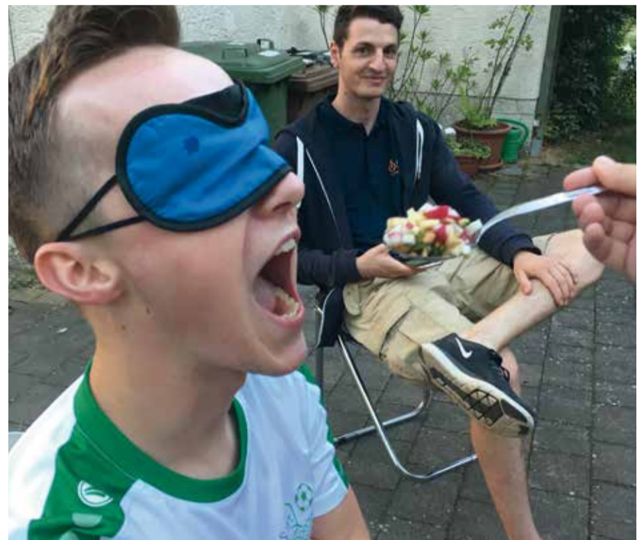
Für diesen Geschmackstest sind gute Geschmacksnerven gefragt!