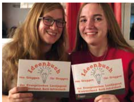
Die „Verursacher“ des Ideenbuchs von der ELJ-Wassermungenau.