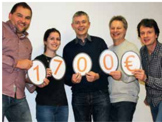
ELAN hat Elan!

ausdrücklich für die Arbeit der vielen Jugendlichen. Der Landjugendstand zeigt das hohe Engagement der ELJ-Gruppen.