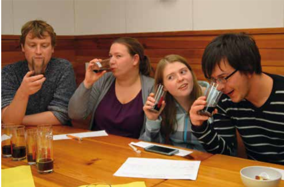
Landesvorstand testet Cola mit allen Sinnen und erhält den Koffeinschock des Jahres!

Landesvorstand nimmt koffeinhaltiges Getränk unter die Lupe