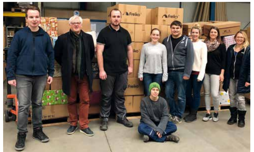
319 Pakete vor Weihnachten wurden von den beiden Kreisverbänden Rothenburg und Uffenheim nach Osteuropa geschickt.

Hilfsbereitschaft voll beladen unterwegs nach Albanien, Bosnien und Rumänien. Dort wurden die Pakete in Krisengebieten rechtzeitig zu Weihnachten an Familien verteilt, denen es an Grundversorgungsmitteln fehlt. Mit einem dieser Pakete kann sich dort eine vierköpfige Familie etwa eine Woche lang ernähren. Wir möchten uns ganz herzlich bei allen Spendern bedanken. Ein besonderer Dank geht an die Firma Freiko, deren Lagerräume im Industriegebiet Gollhofen wir wieder einmal in unsere eigene Packstation verwandeln durften. Außerdem bedanken wir uns auch bei den Paketannahmestellen Hagebaumarkt, der S-Bar in Uffenheim sowie bei der Südzucker AG in Ochsenfurt für die Spende des benötigten Zuckers.