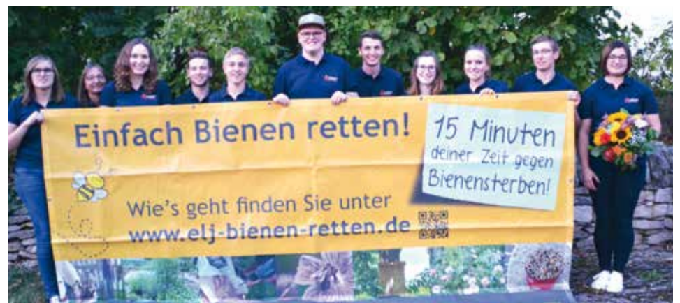
Einfach Bienen retten! Schau doch mal auf die Webseite, dort wird erklärt, wie du ganz leicht einen Bienen-Nistkasten bauen und aktiv werden kannst.

(www.elj-bienen-retten.de) und erklärten, wie schnell man in nur 15 Minuten etwas gegen das Bienensterben tun kann. Am Bürgerfest in Gunzenhausen zeigten sie, wie mit wenigen Mitteln Nistkästen für Bienen gebaut werden können. Dieses Engagement würdigte der BBV mit dem dritten Platz des Landjugendwettbewerbs. Bei diesem Wettbewerb wurden gleich zwei Projekte der ELJ ausgezeichnet: Den zweiten Platz gewann das Gemeinschaftsprojekt „Weidenkapelle“ der Evangelischen und Katholischen Landjugend und der Evangelischen Jugend im Dekanat Oettingen (Bericht Seite 13).