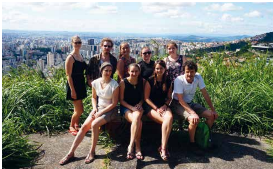
Gruppenfoto vor beeindruckender Skyline - 5,5 Millionen Menschen leben hier.