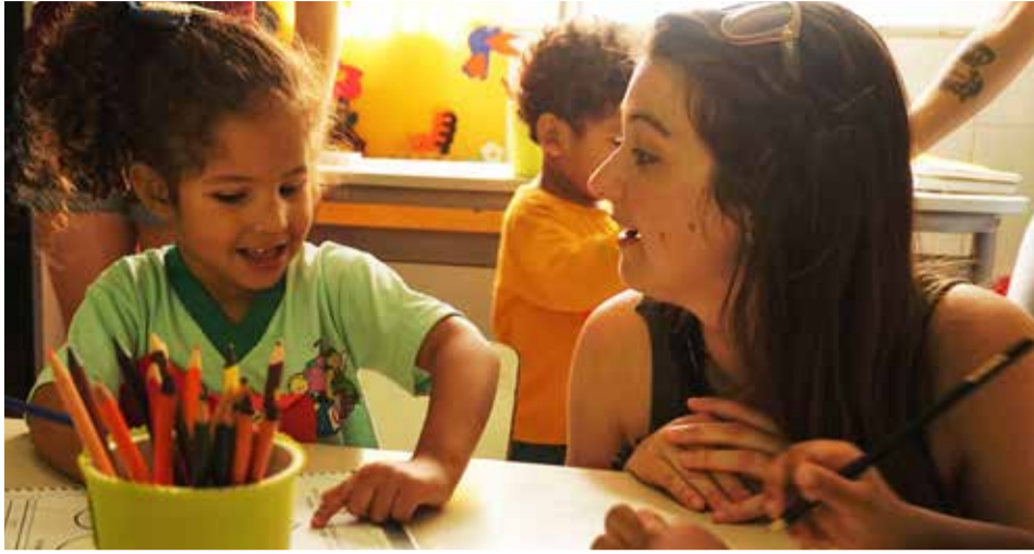
Wir sind von der Arbeit der Kindertagesstätte begeistert.