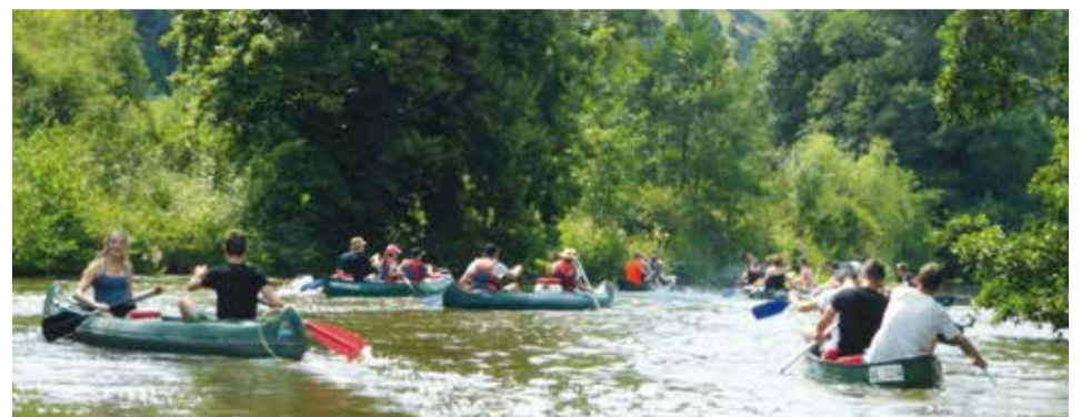
Hammer Wetter auf dem Weg zur Hammerrühle.

Teilnehmenden kurz auf dem Trockenen. Doch dann ging sie los: Die Kanutour des Kreisverbands, die von Zimmern aus bis zur Wasserrutsche an der Hammerrühle führte. Das Wetter hatte es wieder so gut mit dem Kreisverband Weißenburg gemeint, dass es nichts ausmachte, wenn diverse Boote durch eigenes Verschulden oder Fremdeinwirkung versenkt wurden. Das Kanu wurde einfach wieder flottgemacht. Nachdem die Kreisvorstandschaft auch noch für ausreichend Verpflegung gesorgt hatte, war die Stimmung entsprechend ausgelassen.