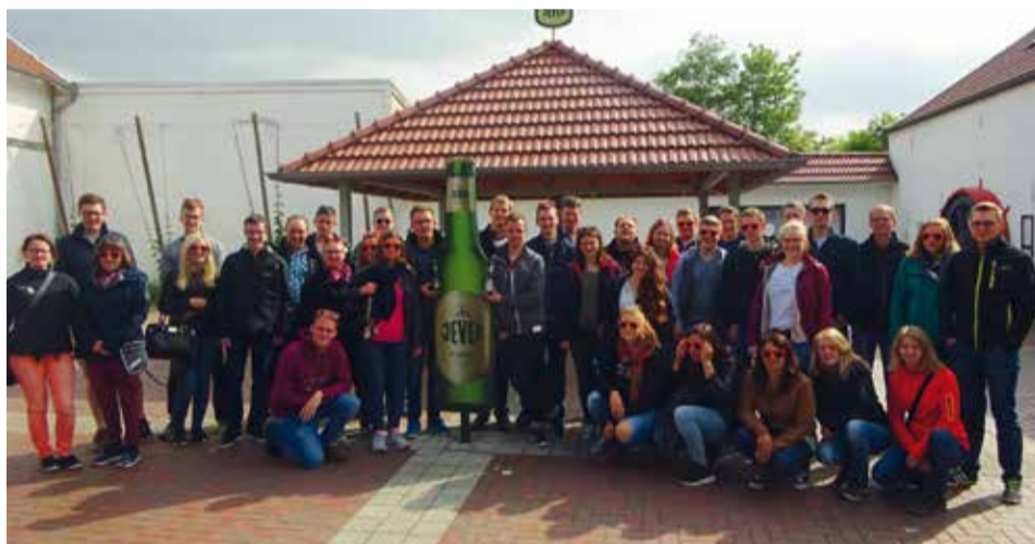
Die Reisegruppe aus Schwabach und Roth erhielt bei der Studienfahrt Einblicke in den Braualltag der Brauerei Jever.