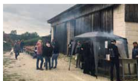
Das Kanzfeuer in Lindenhartd fiel dieses Jahr mit dem WM-Vorrundenspiel Deutschland gegen Schweden zusammen.

Mit dem Anzünden des Kanzfeuer lässt man den Abend in Lindenhartd ausklingen. Der Sieg macht die Atmosphäre mit Bratwurst, Lagerfeuer und Freunden perfekt.