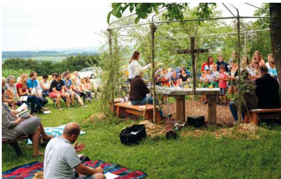
Der idyllische Gottesdienst in der Weidenkapelle Schopflohe sorgte für eine herzliche Atmosphäre.