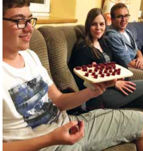
Bei der Gummibärchen-Gruppenstunde gibt es genug zum Naschen, dafür ist gesorgt!

Eines ist klar: In dieser Gruppenstunde gibt es viele Gelegenheiten zum Naschen! Zu Beginn geht es um „Zukunftsvorausagen“, die man mit einem Gummibärchen-Orakel bestimmen kann. Danach gibt es verschiedene Neigungsgruppen. Vom Gummibärchen-Produkttest, über selbstgestaltete Werbespots und Fotoshootings bis hin zur Experimentierküche, in der Gummibärchen selbst hergestellt werden, ist für jeden Geschmack etwas dabei. Gemeinsam werden am Ende des Abends die Ergebnisse begutachtet und viele Gummibärchen verkostet.