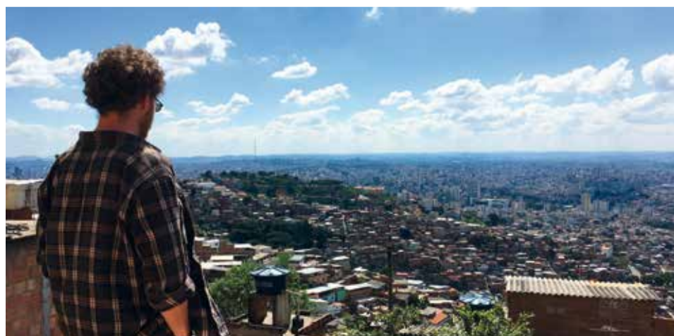
Die prekären Wohnverhältnisse machen betroffen.