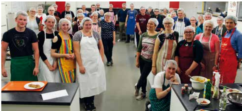
Gemeinsames Kochen macht Spaß!

Roth (rz) - Bei dem diesjährigen Kochduell des Kreisverbands Roth-Schwabach beschäftigten sich die Jugendlichen mit dem Jahresthema „Gut essen - fair leben?“ und achteten auf Regionalität, biologischen Anbau und Fairen Handel bei der Zutatenwahl.