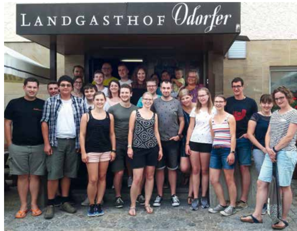
Nach einem ereignisreichen Ausflug kehrte die ELJ-Gruppe des BV Mittelfranken in das Wirtshaus Odorfer ein.

Zum Ausklang des Tages kehrten alle gemeinsam in die Wirtschaft Odorfer ein und genossen im Biergarten die letzten Sonnenstrahlen, bevor es zurück in die Heimat ging.