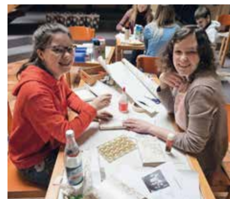
Upcycling-Projekte beim Mitarbeiterwochenende des Arbeitskreises Kinderfreizeit im Kreisverband Nördlingen.