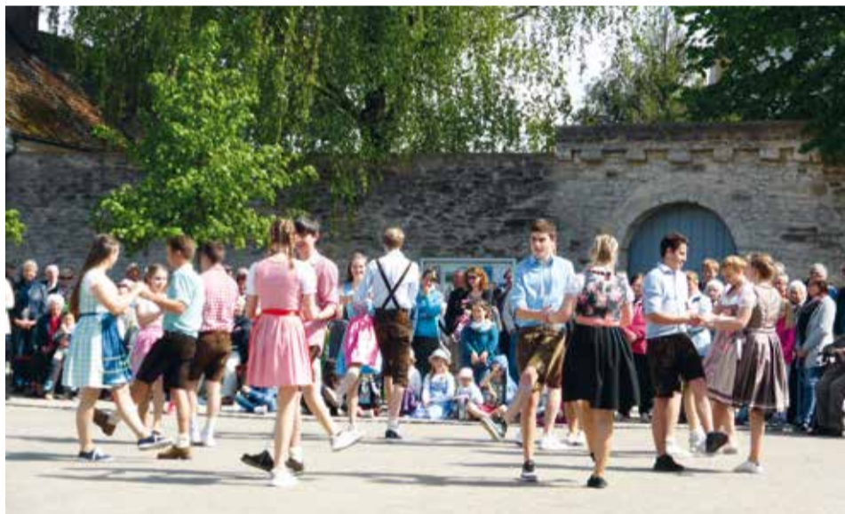
Viel Schwung und Bewegung steckt in der ELJ Sulzkirchen, das zeigte nicht nur die Tanzvorführung zum 60. Jubiläum.