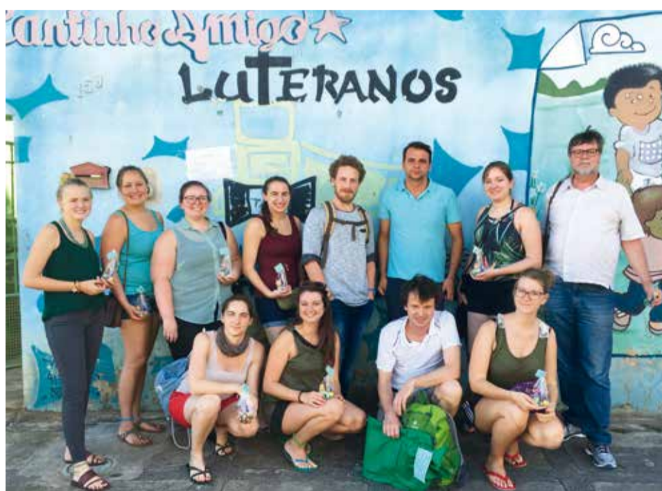
Die Reisegruppe und ihre Gastgeber vor der Kindertagesstätte in Belo Horizonte.