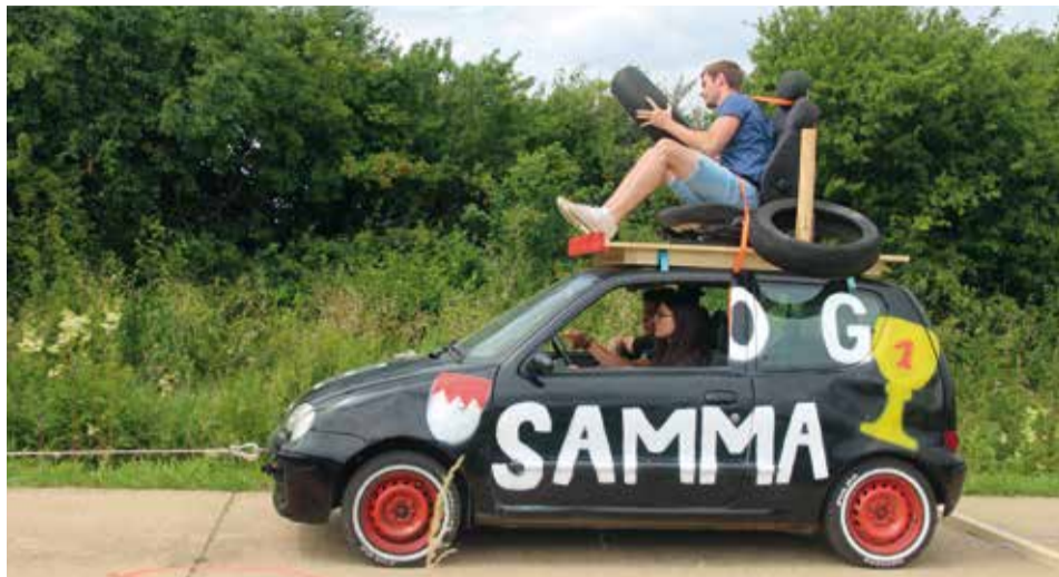
Diese außergewöhnliche Fortbewegungsart konnte beim Spiel ohne Grenzen bewundert werden und die Sammenheimer machten damit dem Veranstaltungsnamen alle Ehre!

Sammenheim (ug) - In „Samma“ ging unter dem Motto „Spiel ohne Grenzen“ an drei Tagen die Post ab.