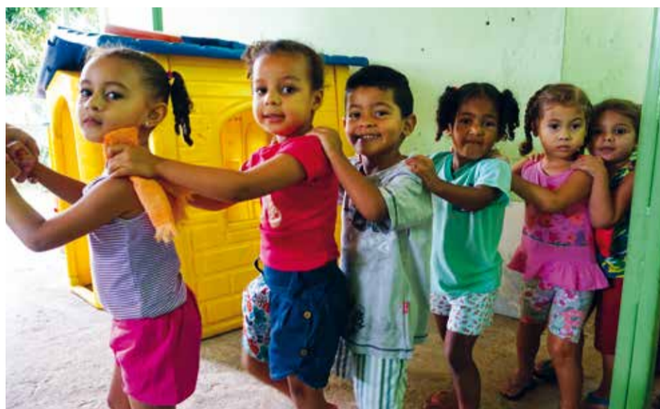
Creche Canthinho - Ein beschützter Ort zum Spielen und Toben.