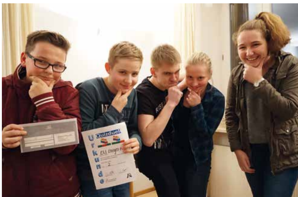
Denkerpose in Nördlingen, das Kreisquiz forderte Wissen und Kreativität!

Knifflige Fragen beim Kreisquiz im Kreisverband Nördlingen