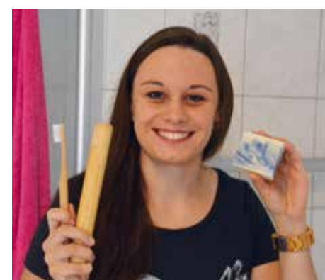
Eins, zwei, drei - Plastikfrei! Versuch dich auch einmal darin und stelle dich neuen Herausforderungen im Alltag!

Weitere tolle Anregungen findest du hier: www.utopia.de