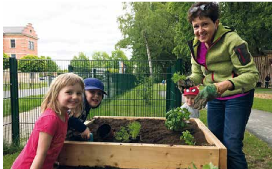
Es ist wichtig, Kindern Gartenerfahrungen zu vermitteln, deshalb bepflanzt Gudrun Brendel-Fischer mit den Kindern des BRK-Kinderhauses in Bayreuth ein Hochbeet.

Gudrun Brendel-Fischer, Ehrenamtsbeauftragte der Bayerischen Staatsregierung und Sprecherin für Fragen der Evangelischen Kirche