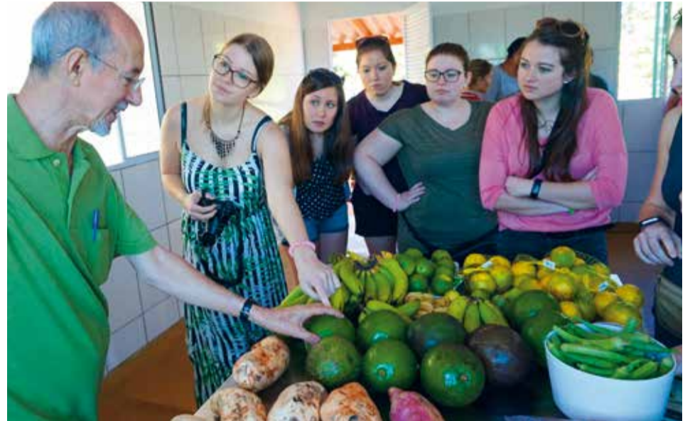
Die Reisegruppe ist von der Sortenvielfalt der Kleinbauern fasziniert.