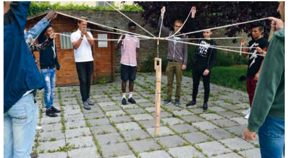
Das Spiel „The Power of Tower“ forderte viel Teamgeist. Die Jugendlichen mussten mit einem Steigbügel, gemeinsam Holzklötze übereinander stapeln.

Wiesenbronn (tr) - Bereits zum vierten Mal wurde Ende Juni zum Grill & Chill mit jugendlichen Flüchtlingen nach Wiesenbronn eingeladen.