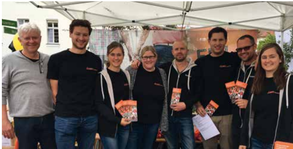
Der Bezirksverband Mittelfranken repräsentierte die ELJ beim Johannitag in Triesdorf und spendete an den ELAN.

auf diese Weise die Arbeit der ELJ. Für die Unterstützung der Landjugendarbeit dankt der ELAN ganz herzlich! Ein Schlaglicht auf die vielfältige und gelungene ELJ-Arbeit wirft die Standaktion des Bezirksverbandes Mittelfranken beim Johannitag in Triesdorf, zu deren Anlass das Foto entstand.