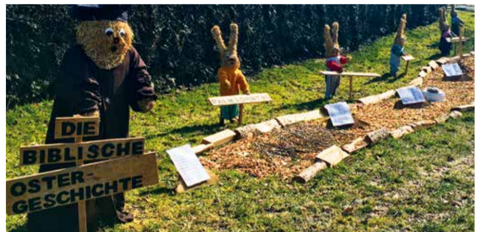
Die Tradition der Stroh-Hasen an Ostern in Silberbach gibt den Bewohnern ein Heimatgefühl.

Laut Greverus (1979) ist Heimat „eine heile Welt und nur in der Dreiheit von Gemeinschaft, Raum und Tradition zu finden, denn nur hier werden die menschlichen Bedürfnisse nach Identität, Sicherheit und aktiver Lebensgestaltung in einem kulturell gegliederten Territorium befriedigt.“