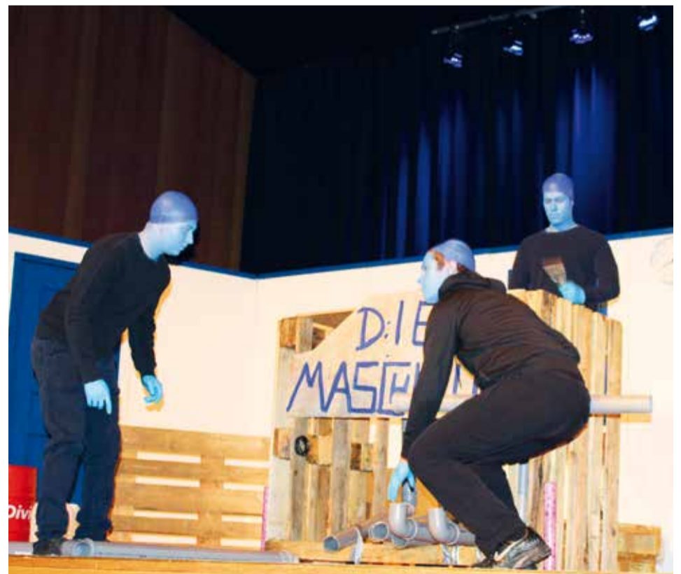
Blaue Gesichter in Schwabach - Landjugendliche aus Kammerstein verwandelten sich im Markgrafensaal zur „Blue Man Group“ und machten fast den echten blau maskierten Schauspielern aus Berlin Konkurrenz.

und zeigte eine Performance als „Blue Man Group“. Die ELJ Roth trat mit einer gespielten Vorstandssitzung auf und die ELJ Barthelmesaurach präsentierte einen Einakter über eine „Kurfuscher-Praxis“. Mitglieder der ELJ Kammerstein umrahmten den Abend mit ihrer Band „Beats of Peace“. Inzwischen ist es Tradition, dass der ELAN den Theaterabend mit einer Verlosung bereichert.