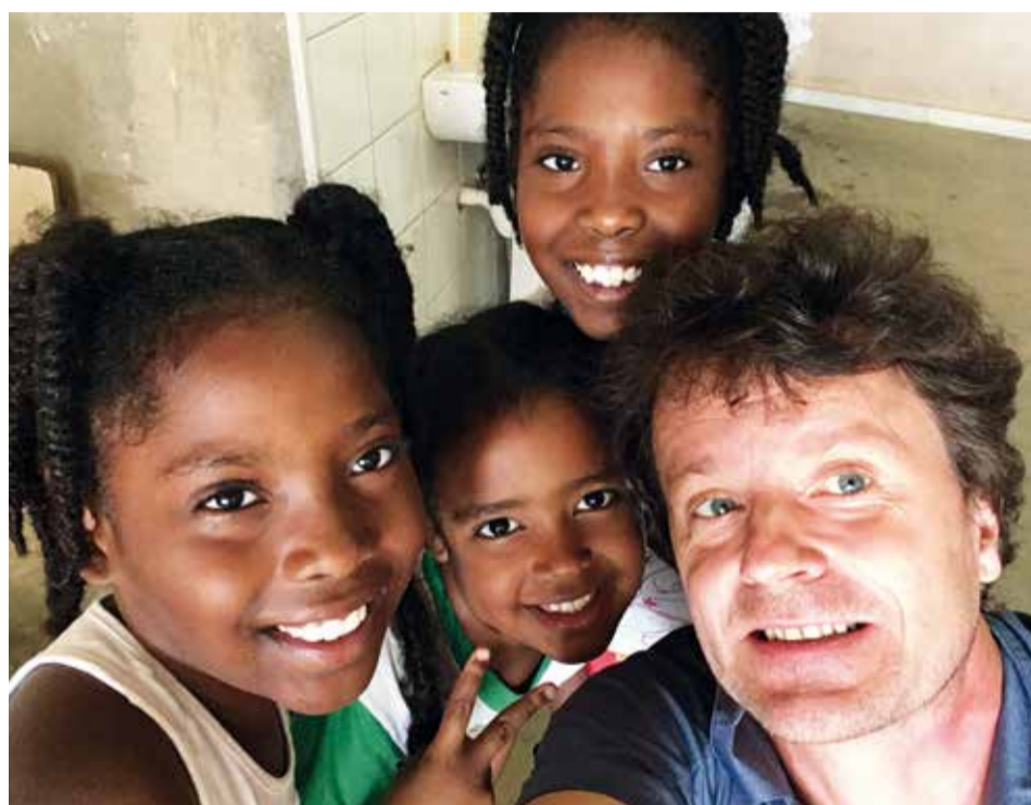
Der Kontakt funktioniert auch über Sprachbarrieren hinweg super.