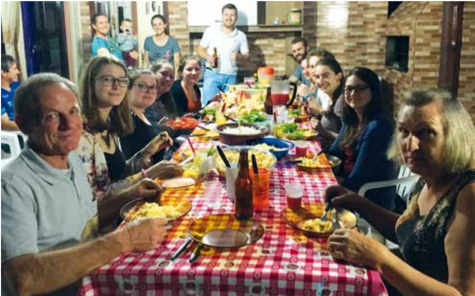
Die Gastfreundschaft ist überwältigend.