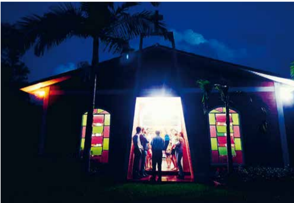
Ostergottesdienst - der gemeinsame Glaube verbindet über Kontinente.