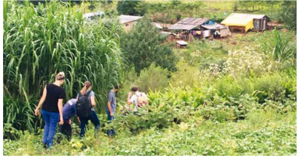
Dank der Unterstützung der CAPA reicht auch ein kleines Stück Land zum Leben.