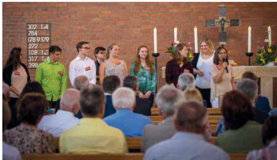
Der Kreisverband Ansbach feierte sein 60. Jubiläum.