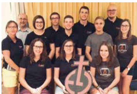
Die neue Vorstandschaft im KV Gunzenhausen-Heidenheim freut sich auf das 60. Jubiläum im Mai 2019.

Gunzenhausen (rw) - Schneller als erwartet ging die Neuwahl des ELJ Kreisverbands Gunzenhausen-Heidenheim über die Bühne. Die Mehrheit der Vorstandsmitglieder stellte sich zur Wiederwahl und wurde erneut gewählt.