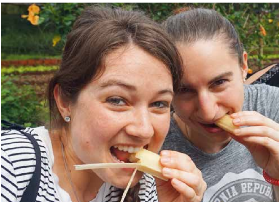
So viel Neues zu entdecken - Zuckerrohr im Test.