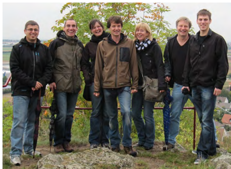
Ja, im Ries ist halt was los., nicht nur beim Meteoriteneinschlag!

Zum ersten Mal durchgeführt wurde ein Ausflug für die ELAN-Mitglieder und Gäste. Ziel war das Nördlinger Ries, das als Meteoritenkrater eine einmalige und interessante Landschaft zu bieten hat. Im Rahmen einer geologischen Führung wurden den Teilnehmern die Auswirkungen des Meteoriteneinschlags erläutert. Im „fürstlichen Wallersteiner Keller“klang der Tag gemütlich aus.