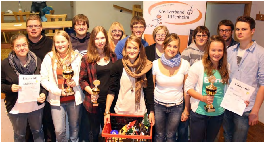
Ob Erster oder Zweiter ist doch völlig egal. Hauptsache wir gewinnen etwas Essbares!

Reusch (mld) - Wissenschaft und Informatik, ELJ und Kirche, Klatsch und Tratsch - durch diese und noch weitere Quizbögen kämpften sich beim diesjährigen Quiz des KV Uffenheim 20 verschiedene ELJ-Gruppen aus der ganzen Umgebung.