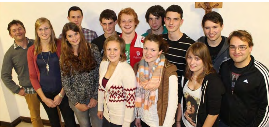
Eine Vorstandschaft mit Warteliste? Nicht mit uns - da erweitern wir lieber das Gremium.