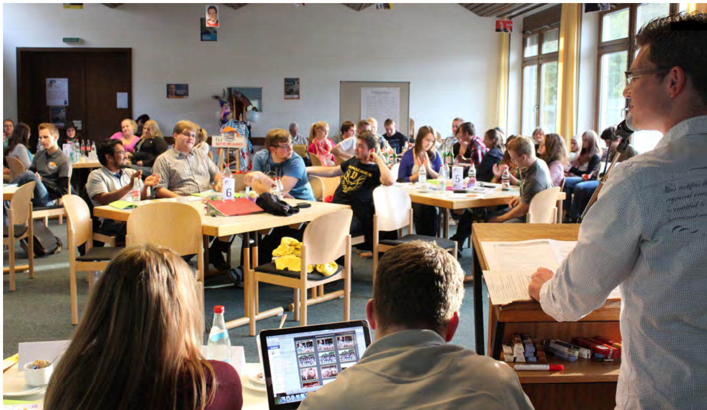
Energieschub für das Bildungszentrum: Die Delegierten sprachen sich dafür aus, eine Energiegenossenschaft ins Leben zu rufen und auf den Dächern der Einrichtung Photovoltaik-Anlagen zu errichten