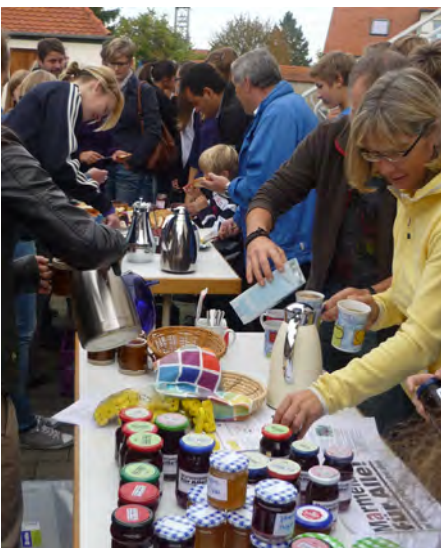
Hier fällt die Auswahl schwer.

Dürrenzimmern (fr) - „Marmelade für alle“ heißt aktuell eine Kampagne der Evangelischen Jugend in Deutschland, die zum Anlass für einen Erntedank-Jugendgottesdienst in Dürrenzimmern wurde.