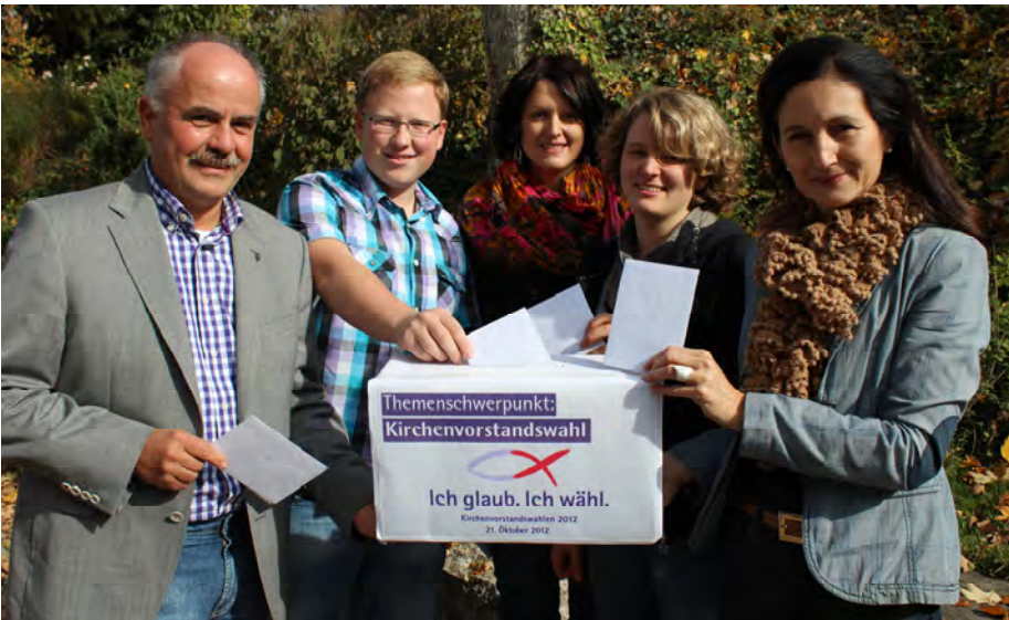
Sie hatten nicht die Qual der Wahl - sie gingen alle wählen!

man: „na, wer hat denn jetzt gewonnen?“ Und siehe da: Die ELJ hat die Wette in beiden Dekanaten nicht nur knapp, sondern ganz klar gewonnen. Im Dekanat Pappenheim lag die durchschnittliche Wahlbeteiligung bei 31,7%. In den Dörfern mit ELJ-Gruppe dagegen bei 47,93%. Im Dekanat Weißenburg lag die Wahlbeteiligung bei