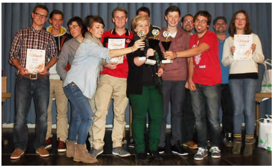
Die strahlenden Sieger beim Bezirksquiz - Pappenheim wir kommen!

Die vier besten ELJ - Gruppen haben sich für das Landesquiz am 24.02.2013 in Pappenheim qualifiziert.