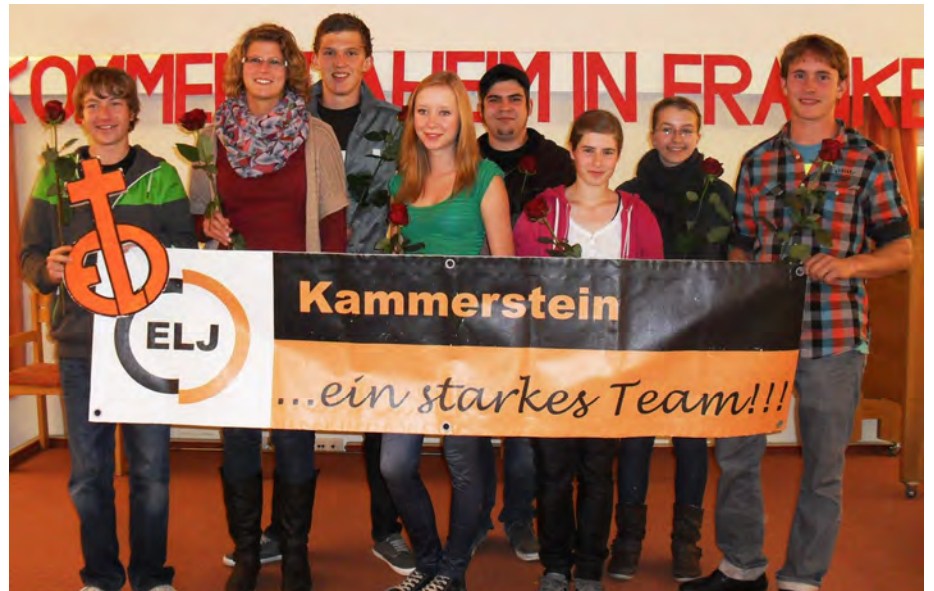
Die Kammersteiner - ein starkes Team!