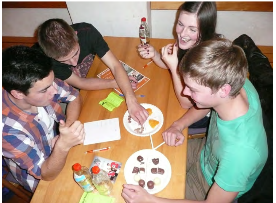
No-Name oder Markenprodukt? Das ist hier die Frage!

Weißenburg (rz) - Beim diesjährigen Quizturnier der Evangelischen Landjugend im KV Weißenburg war wieder einmal ein umfangreiches Allgemeinwissen gefragt. Als bestes Rateteam konnte sich die ELJ Göhren durchsetzen und darf sich nun für ein Jahr „schlauste Landjugend im Landkreis“ nennen.