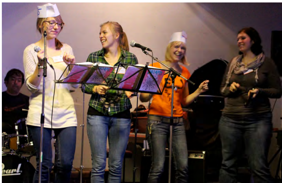
Live on stage: Die Shootingstars aus der Fashionmetropole Pappywood heizen den Partygästen auf dem restlos ausverkauften Gig kräftig ein.