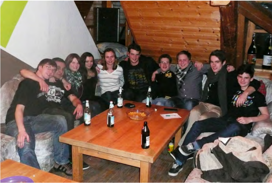
Unser Raum - unser Reich. Unterm Dach lässt es sich gut leben!

Durch den Gemeindesaal, der auch in der Pfarrscheune untergebracht ist, muss man sich immer wieder arrangieren, manchmal etwas leiser sein und natürlich alles sauber und ordentlich halten. Aber das ist meistens kein Problem - außer nach den Partys, wenn der Kindergottesdienst dann einmal den Raum mitbenutzen möchte.