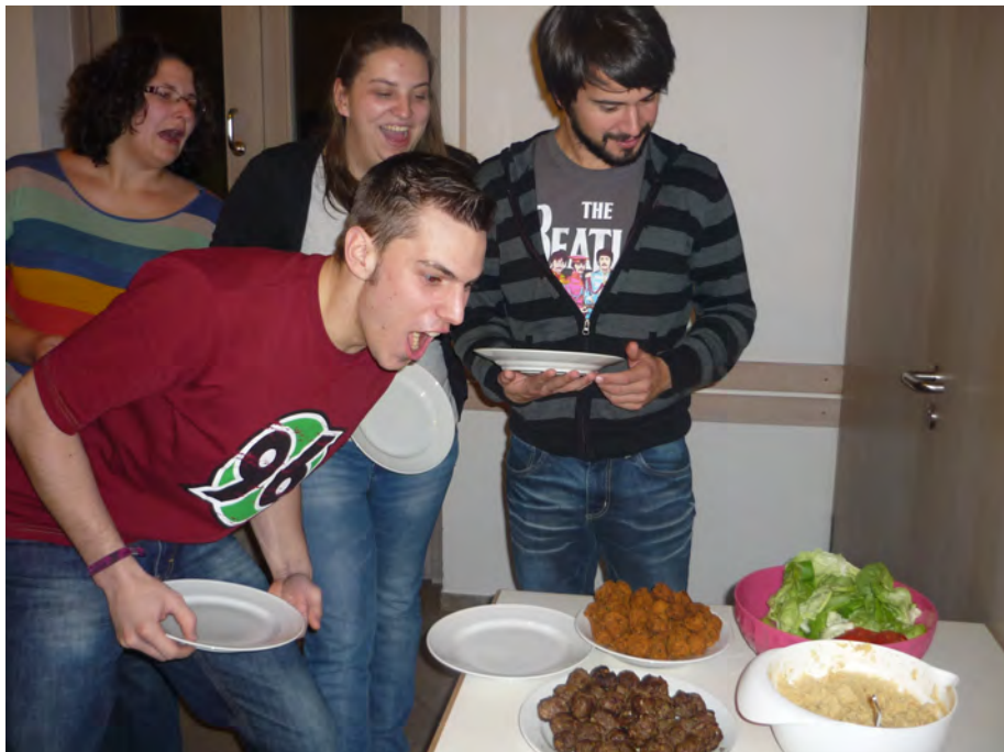
Waaaaaaahnsinn - so viele Hackbällchen auf einem Haufen!