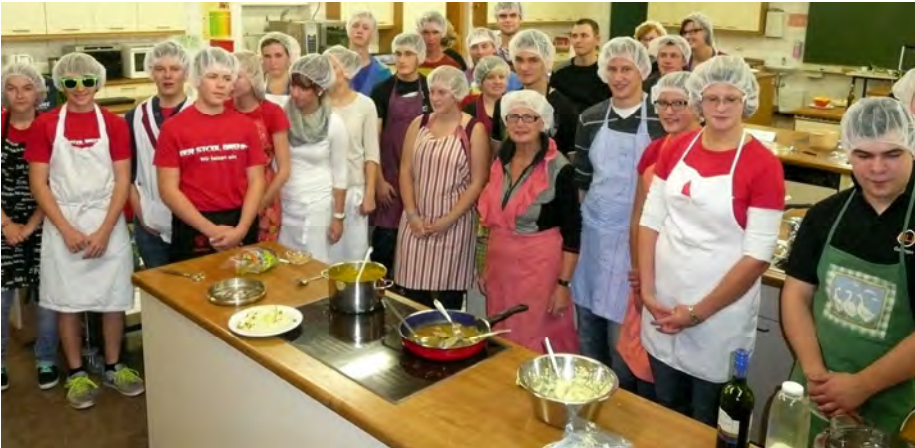
Bei uns findet man kein Haar in der Suppe!

Roth (hub) – „Viele Köche verderben den Brei“ – diese Redensart gilt nicht bei der ELJ. Der KV Roth/Schwabach hatte seine Ortsgruppen zu einer besonderen Kreisversammlung eingeladen. Im Amt für Landwirtschaft in Roth traten die verschiedenen ELJ-Gruppen zu einem „Kochduell“ an.