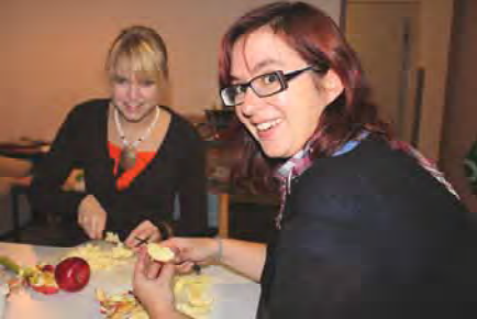
Die Qual der Wahl

Pappenheim (tw/eg) - Während draußen die ersten Schneeflocken des Jahres das schöne Altmühltal in heimeliges Weiß hüllen und die Außentemperaturen Richtung Schockfrostung wandern, holen wir uns die Kälte in süß-cremiger Form in den warmen Bau der LVHS: