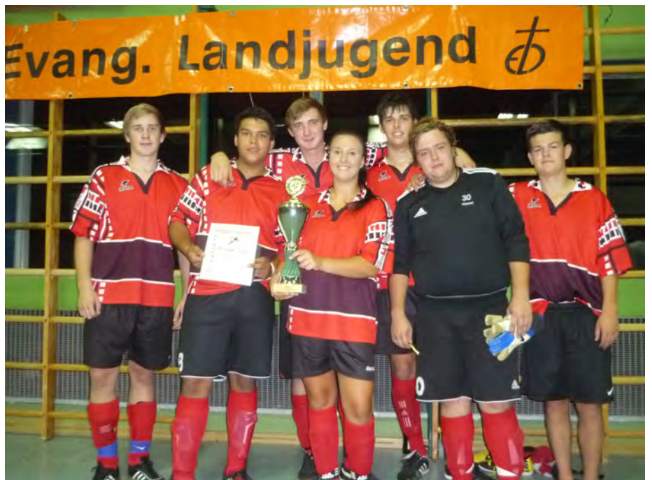
An Tagen wie diesen...

Oettingen (fr) - Sieben Mannschaften nahmen beim diesjährigen Fußballturnier der ELJ in der Dreifachhalle Oettingen teil. Spaß, Fairplay und gute Laune standen dabei ganz im Vordergrund.