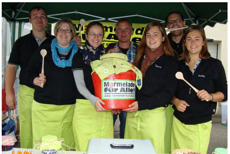
Die Schürzenjäger spielen in Feuchtwangen, die Schürzenträger kochen in Uffenheim!

Durch den Stand am Handwerkermarkt und den kommenden Stand am Uffenheimer Weihnachtsmarkt im Dezember erhoffen sich alle Beteiligten wieder viele Päckchen.