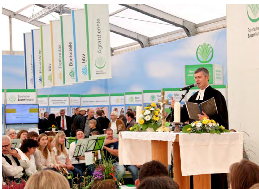
Der Landjugendpfarrer ist überzeugt: Gottesdienste können Sorgen mildern.

Schließlich empfahl Schleier einen Gottesdienstbesuch. In einer Untersuchung der Postbank nach Glücksfaktoren landete dieser immerhin auf Platz neun.