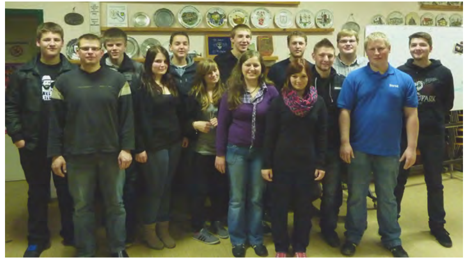
Um unseren BV zu schlagen, mussten wir uns gar nicht plagen!

Gräfenthal (cn) - Einen spannenden Wettkampf lieferte sich der BV im Rahmen einer Gruppenstunde mit der ELJ Gräfenthal.