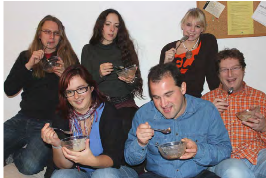
Bei der Mistgabelredaktion gibt's was auf die Löffel

Rumlastigkeit nicht vollständig überzeugen konnte. Die letzten beiden Plätze teilten sich das noch ausbaufähige Apfelstrudeleis, dessen Sahne sich in Butter verwandelt hatte und das Wintereis, das trotz gutem Geruch durch die Fruchtmixüberfrachtung leider wertvolle Punkte verlor.