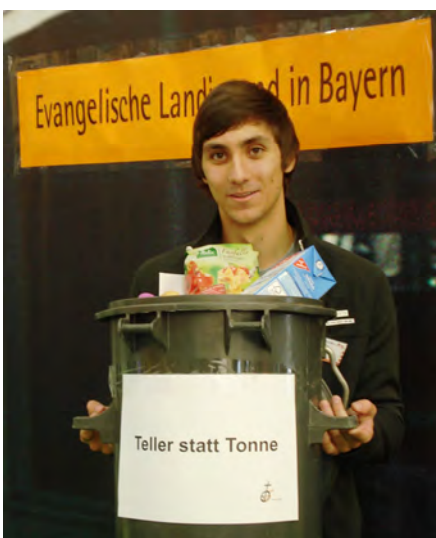
Bei uns kommt nix in die Tonne!

Das Herzstück der Landjugendaktionen bildete jedoch der Messestand der ELJ in Halle 9, der unter der Überschrift „Teller statt Tonne“ über die Auswirkungen der Lebensmittelverschwendung informierte. Anhand typischer Oktoberfest-Nahrungsmittel wie Brathähnchen, Riesenbreze oder einer Maß Bier wurden die Auswirkungen auf die Kohlendioxidbilanz, aber auch auf den Geldbeutel von Erzeuger und Verbraucher verdeutlicht. So kostet eine Wiesenmaß im Bierzelt 9,50 Euro, der Landwirt erhält davon für Gerste und Hopfen gerade einmal 10 Cent.