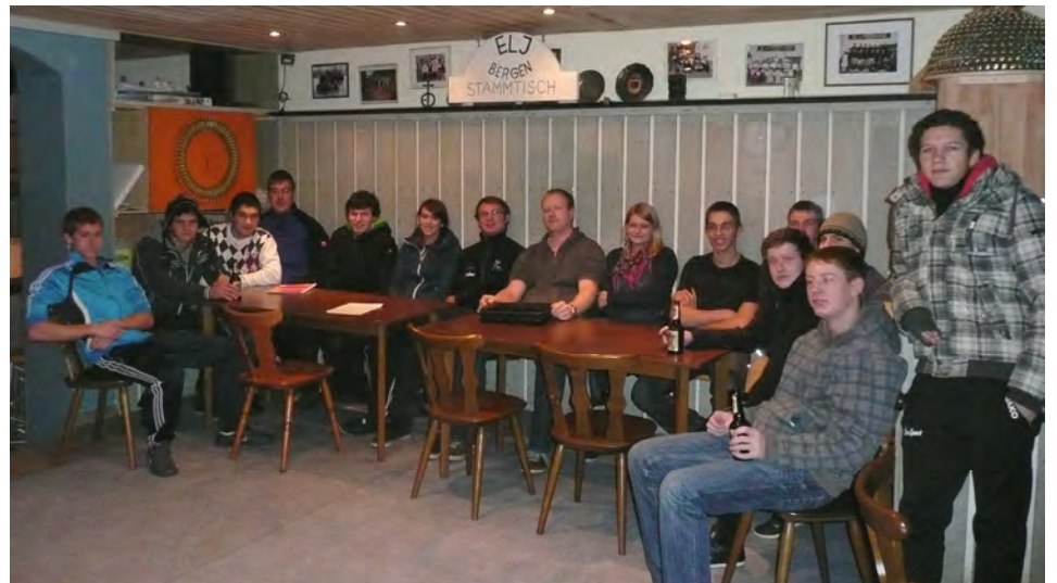
Bereits seit 50 Jahren von der Landjugend in Beschlag genommen - Der Raum in Bergen

aufmacht trifft man sich. Und natürlich zu den Festen. Die gibt es im Landjugendraum nicht zu knapp: Geburtstagsfeiern, Weißwurstfrühstück, Weihnachtsfeier, Silvester... und natürlich die legendären Cocktailpartys. Da drängen sich dann um die 100 Partygäste in den Raum. Mehr gehen auch theoretisch nicht rein. Es wird aber auch einiges dafür getan, dass der Raum weiterhin in Schuss bleibt. Ausgeklügelte Putzpläne werden wöchentlich eingeteilt, Getränke müssen natürlich immer da sein und auch sonst investiert die Gruppe einiges in ihren Raum. Das wird auch von der Gemeinde Bergen honoriert: Neben der kostenlosen Überlassung der Räumlichkeiten haben sie der Gruppe eine neue Heizung spendiert.