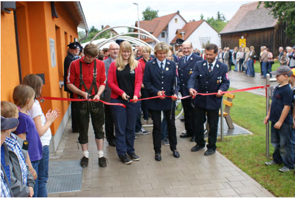
Gemeinsam im Haus - Gemeinsam bei der Eröffnung.

Schönbronn (sd) - Die ELJ Gastenfelden ist angekommen - in ihrem neuen Jugendraum in Schönbronn. Ein ganz neues Haus hat dort die Gemeinde gebaut, welches zukünftig von der Freiwilligen Feuerwehr und der Jugend der Gemeinde gemeinsam „bewohnt“ wird.