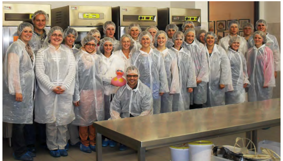
Sag mal, wo kommt ihr denn her? Aus Eysölden. Bitte sehr!

Nachdem auch der letzte Ratebogen von der Kreisvorstandschaft ausgewertet war, standen die Gewinner fest. Nach den Siegern aus Burgsalach kamen die Teams aus Geislohe und Göhren auf die Plätze zwei und drei.