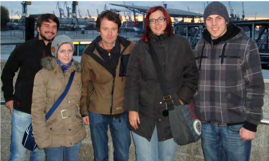
Auf der Reeperbahn Nachts um halb eins...

Am darauffolgenden Sonntag machten sich die ELJ-ler in aller Frühe auf zum Hamburger Fischmarkt. Fasziniert betrachteten sie, wie in aller Frühe nicht nur Fisch verkauft wurde, sondern ein regelrechter Jahrmak, mit Musik, seltsamen Gestalten und allem was dazugehört, stattfand. Mit vielen spannenden Eindrücken und einem riesigen Obstkorb machten sich die wackeren Entdecker alsbald auf ihre lange Heimreise an.