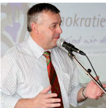
Prominenter Gast auf der Landesversammlung: Der neue BBV-Präsident Walter Heidl stellte sich auf dem Podium den Fragen der Delegierten.