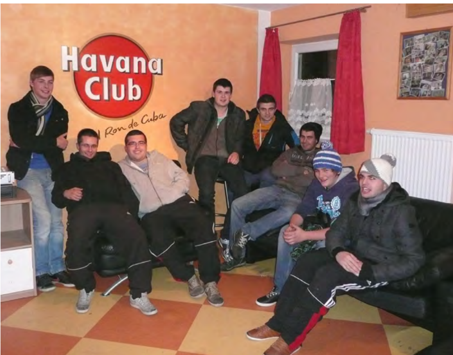
Erleichterung nach getaner Arbeit - sooo schön ist unser Gruppenraum jetzt!

Ettenstatt (rz) - Vor dem neuen Gruppenraum war erst mal ordentlich Schweiß angesagt. Die ELJ-Ettenstatt hat nämlich für ihren neuen Raum ganz schön schuftet müssen.