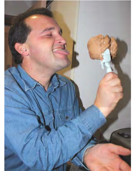
Eis-Age 5 „Voll gerührt“

Die Schnellvariation bei der fertig gekaufte Vanilleeis mit Spekulatius, Schokolade und Zimt vermerkt wird, überzeugte eiskalt, dicht gefolgt vom Mozarts Traum. Aufgrund der Eigenproduktion ist dieser aber der heimliche Sieger. Der dritte Platz geht an das Lebkuchenparfait, das uns aufgrund seiner hohen Rosinenkonzentration und