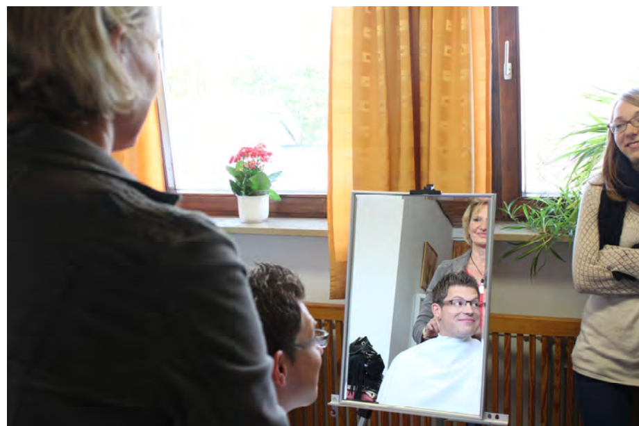
Spieglein, Spieglein an der Wand - selbst bei einem attraktiven Landesvorsitzenden lohnt sich noch eine Farb- und Stilberatung.