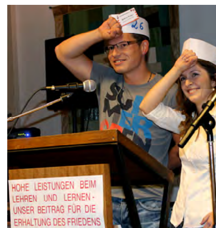
Freundschaft! Nummer 8 und Nummer 26 erklärten ihren Genossen die Vorteile des Kommunismus. Und wehe man verstößt gegen das Regelwerk!