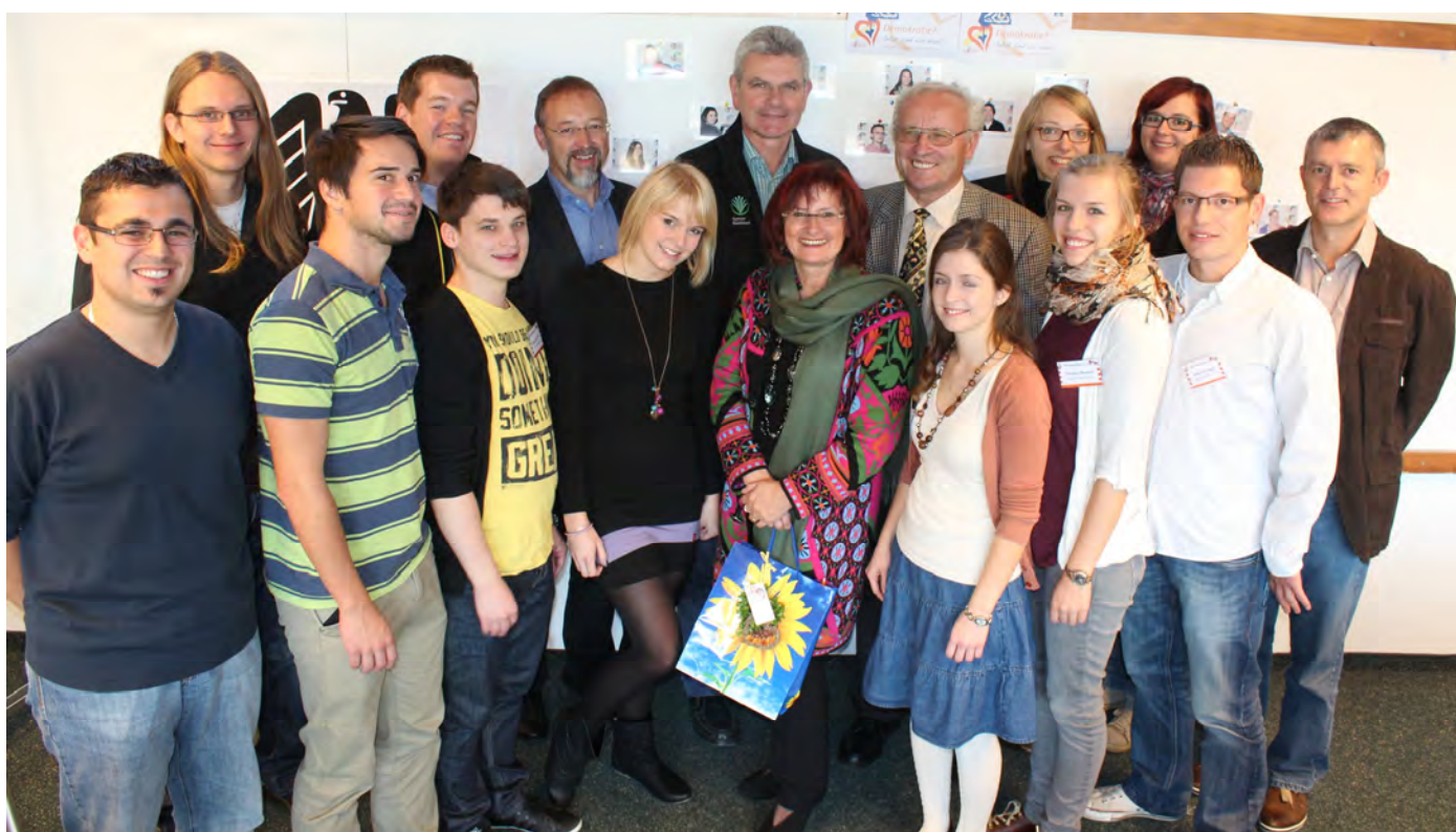
Mei schau die guat aus: Trotz früher Uhrzeit und intensiven Diskussionen machen Landesvorstand, Politiker und Referenten eine gute Figur.