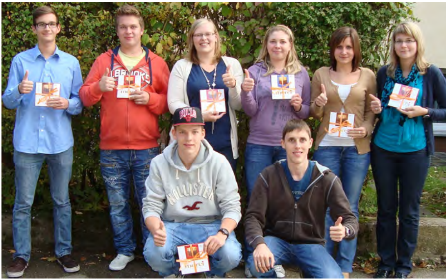
Ungerecht - die kriegen gleich zu Beginn ihrer ELJ-Arbeit Schokolade!

Die KVler kommen aus den Ortsgruppen Baudenbach, Dachsbach, Gutenstetten und Vestenbergsgreuth-Schornweisach.